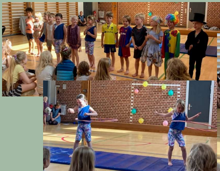
Billederne er fra skolestarternes store cirkusforestilling i børnehaven.

Har du et skolestarterbarn, så vær opmærksom på, at man møder ind i SFO'en fra mandag den 29. juli og første skoledag er mandag den 12. august.